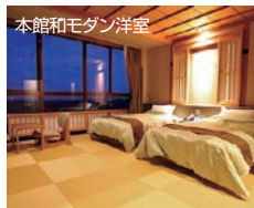
本館和モダン洋室