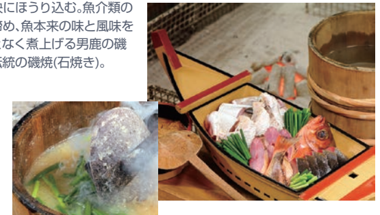
名物磯焼(石焼き) ※調理イメージ